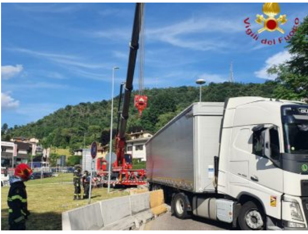
Viadotto dei Lavatoi, tir incastrato e sanzionato