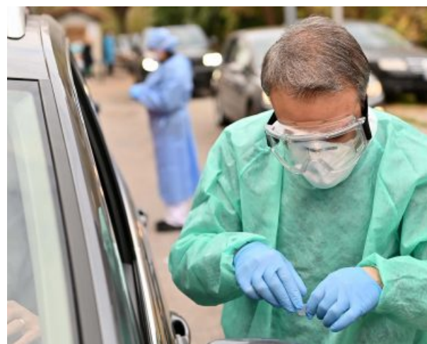
Da oggi è in vigore il Green pass europeo