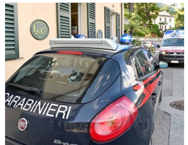
Incidente nautico a Tremezzina: già al